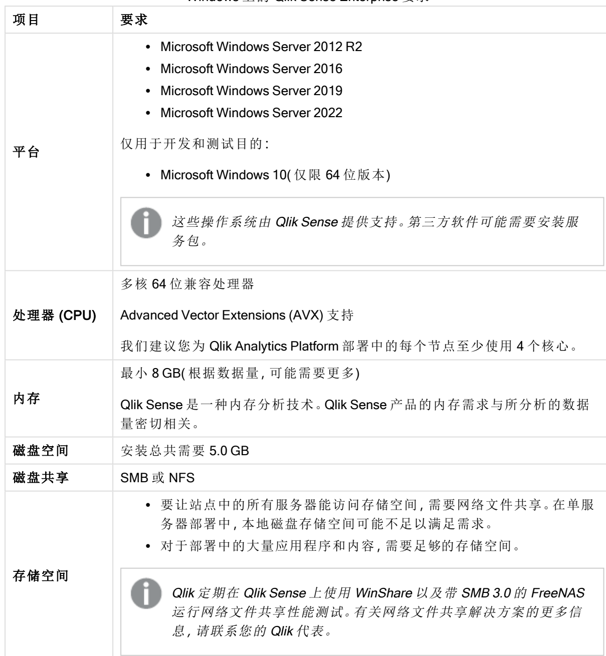
Windows 上的 Qlik Sense Enterprise 要求